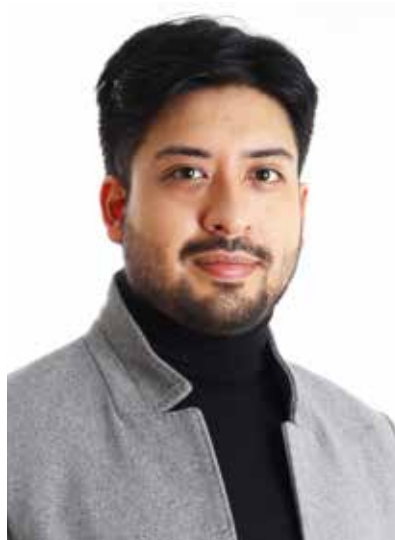
Por Caleb Rojas Castillo

Esto resultó en un aumento de las menciones y referencias directas a los ODS en los planes de gobierno de las elecciones de 2021, frente a lo observado en los comicios de 2016, como