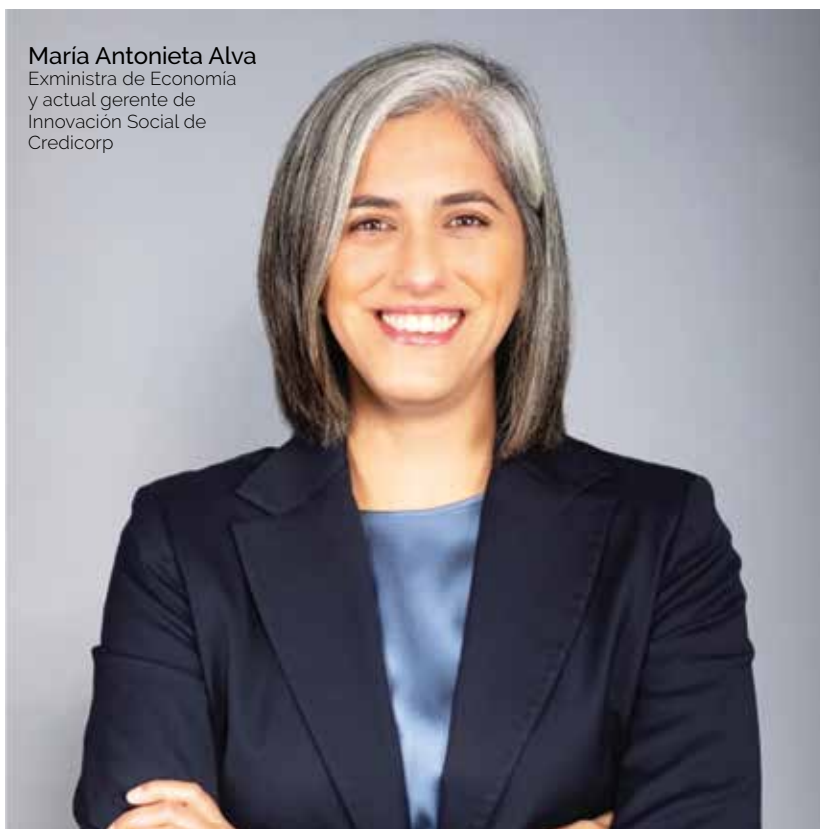
María Antonieta Alva Exministra de Economía y actual gerente de Innovación Social de Credicorp

No es casualidad que haya también un Consejo Fiscal, una autoridad independiente que rinde cuentas.